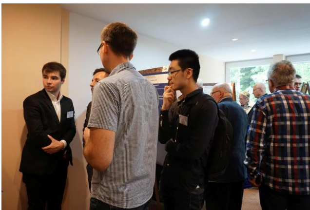
Rys.5. Sesja posterowa (plakatowa)

W kolejnych dniach autorzy przedstawiali efekty swojej pracy na sesjach posterowych i w formie wygłaszanych referatów.