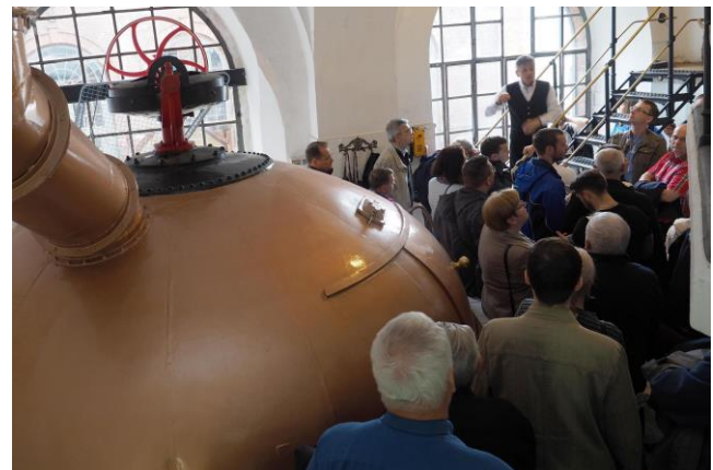
Rys.6. Wycieczka turystyczna do browaru zamkowego w Cieszynie

Tradycją stało się także organizowanie wycieczki turystycznej. W tym roku goście naszej konferencji odwiedzili Cieszyn i to zarówno ten po Polskiej jak i po Czeskiej stronie granicy. Kulminacją wycieczki było zwiedzanie cieszyńskiego browaru zamkowego i degustacja produkowanych tam, na oryginalnych i ponad 100 letnich urządzeniach, piw.