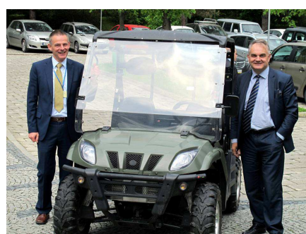
Gościem honorowym wystawy pojazdów elektrycznych był Premier Waldemar Pawlak

Gościem honorowym Seminarium był Premier Waldemar Pawlak, który przyleciał do Rytra na zaproszenie dyrektora KOMEL-u, specjalnie na wystawę pojazdów elektrycznych. Podczas wizyty Premier zapoznał się z całą flotą prezentowanych pojazdów, a większość z nich osobiście przetestował.