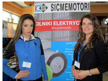
Prezentacje na stoiskach reklamowych

Na Seminarium 18 firm zaprezentowało nowe technologie, wyroby i usługi, zarówno w formie komunikatów reklamowych, jak i na stoiskach firmowych.