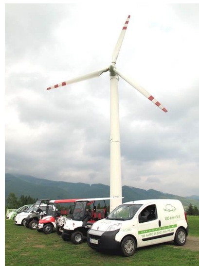
Kordon pojazdów elektrycznych "wspiął się aż pod samą elektrownię wiatrową"

Wzorem lat ubiegłych w trakcie Konferencji zaprezentowano pojazdy z napędem elektrycznym, a goście mieli możliwość przetestować ich walory i osobiście zasiąść za kierownicą. Tegorocznej wystawie towarzyszyła parada pojazdów elektrycznych, w której to dzielne "elektryki" zaprezentowały swoje wdzięki pokonując trasę spod hotelu aż pod elektrownię wiatrową.