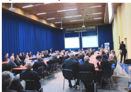
Obrady plenarne zgromadziły liczne grono słuchaczy

Tegoroczna Konferencja PEMINE została po raz pierwszy objęta honorowym patronatem Ministra Energii - Pana Krzysztofa Tchórzewskiego . Patronat nad Konferencją po raz kolejny objął Komitet Elektrotechniki PAN. Konferencję zorganizowano przy współpracy Stowarzyszenia Elektryków Polskich.