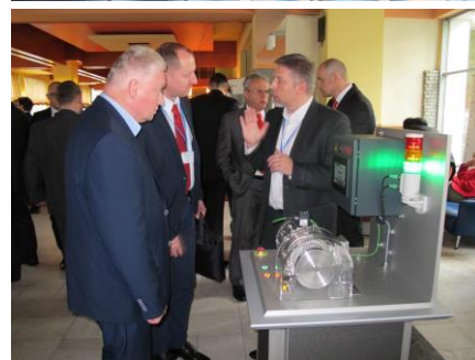
Stoiska firmowe, w tym stoisko reklamowe firmy Schaeffler (poniżej)

Na stoisku KOMEL zaprezentowano nową wersję napędu elektrycznego do łodzi oraz informacje dot. oferowanych usług, m. in. w zakresie: elektromobilności, cięcia laserem, hydrogeneratorów oraz zespołów elektromaszynowych. W ramach pa-