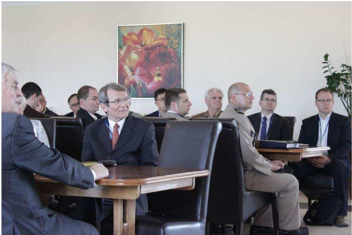
Uczestnicy Sympozjum SME 2015 podczas pierwszej ogólnej sesji plenarnej