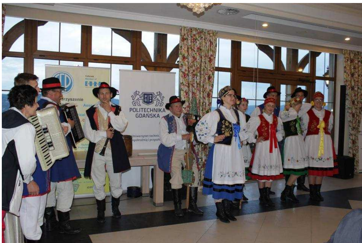
Wystąpienie Kaszubskiego Zespołu Pieśni i Tańca "Chmielanie" przed uroczystą kolacją koleżeńską