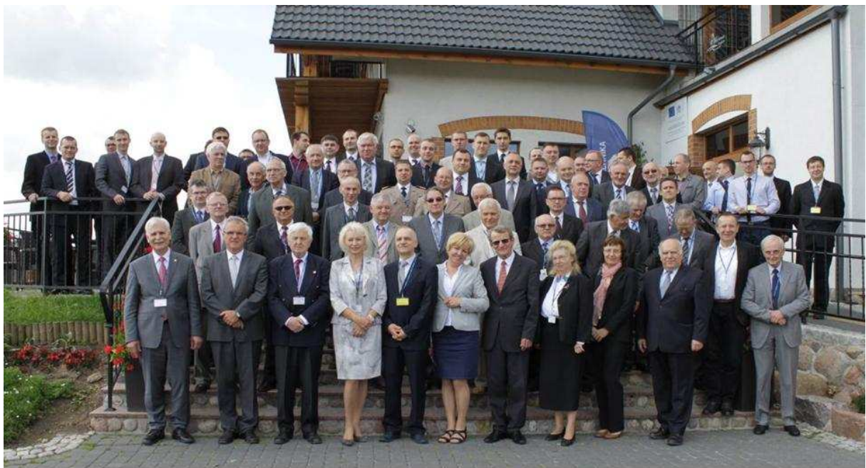
Uczestnicy Sympozjum SME 2015