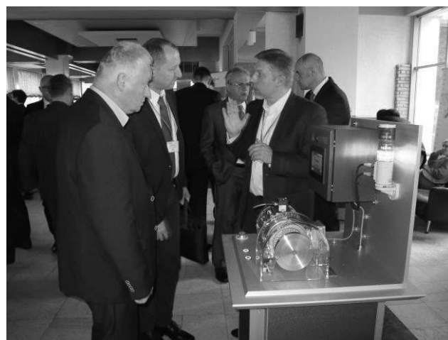
Stoiska firmowe, w tym stoisko reklamowe firmy Schaeffler

Na stoisku KOMEL zaprezentowano nową wersję napędu elektrycznego do łodzi oraz informacje dot. oferowanych usług, m. in. w zakresie: elektromobilności, cięcia laserem, hydrogeneratorów oraz zespołów elektromaszynowych. W ramach paneli informacyjno-promocyjnych zorganizowano trzy sesje prezentujące: nową generację wysokosprawnych elektrowibratorów do urządzeń wibracyjnych, bezszczotkową wysokomomentową zakrętarke elektromechaniczną oraz prace realizowane w ramach programu LIDER VII: „Innowacyjne Rozwiązania Napędu Bezpośredniego Pojazdów Elektrycznych.”