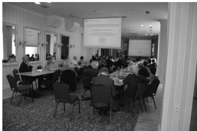
Widok sali obrad