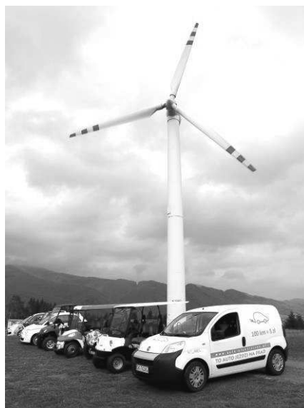
Kordon pojazdów elektrycznych "wspiął" się aż pod samą elektrownię wiatrową

Wzorem lat ubiegłych w trakcie Konferencji zaprezentowano pojazdy z napędem elektrycznym, a goście mieli możliwość przetestować ich walory i osobiście zasiąść za kierownicą. Tegorocznej wystawie towarzyszyła parada pojazdów elektrycznych, w której to dzielne "elektryki" zaprezentowały swoje wdzięki pokonując trasę spod hotelu aż pod elektrownię wiatrową.