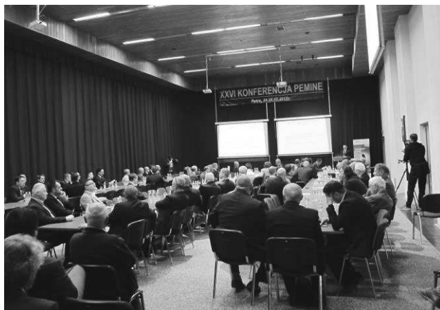
Obrady plenarne zgromadziły liczne grono słuchaczy

Tegoroczna Konferencja PEMINE została po raz pierwszy objęta honorowym patronatem Ministra Energii - Pana Krzysztofa Tchórzewskiego . Patronat nad Konferencją po raz kolejny objął Komitet Elektrotechniki PAN. Konferencję zorganizowano przy współpracy Stowarzyszenia Elektryków Polskich.