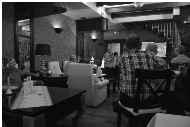
Prelekcja poświęcona rocznicy „700 lat miasta Lublin”